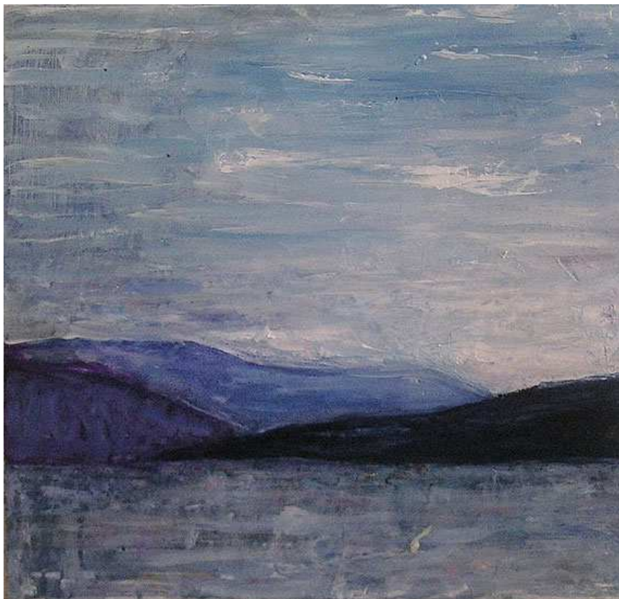
Серена Ноно. Ясно. Холст. Масло. 50x50.