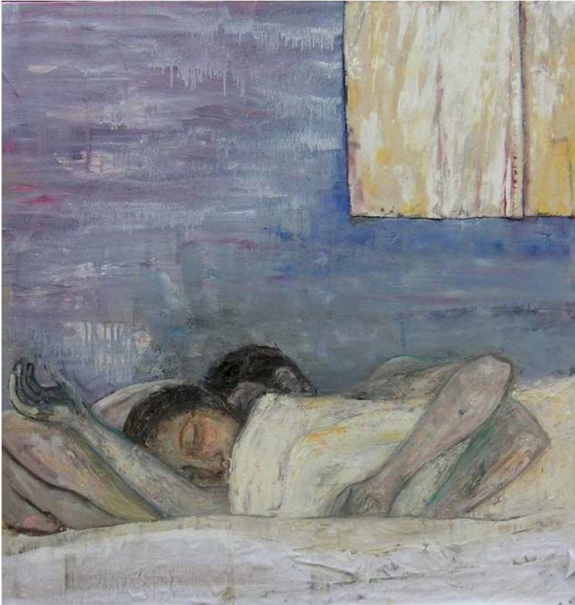
Серена Ноно. Спящие фигуры. Масло и ткань на холсте. 100x100.