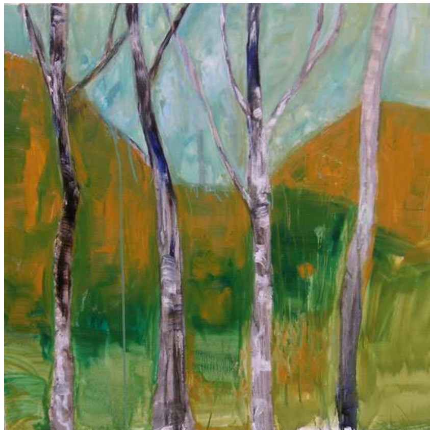
Серена Ноно. Берёзы. Холст. Масло. 100x100.