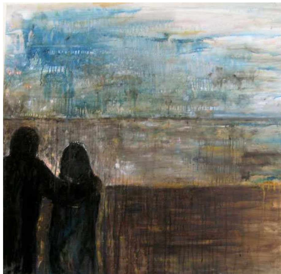
Серена Ноно. Фигуры. Холст. Масло. 100x100.

Пахнет в воздухе росой – гибелью тумана. С горизонта полосой плотно слит Мурано. Можно быстро в барку сесть и приплыть на остров, где покажет ровно шесть стрелочный апостроф на высокой часовой стефановской башне, где маэстро с головой мудрой, как у Грамши, выдувает из стекла дивную посуду, что любого б увлекла приближеньем к чуду. Но остывшее стекло не нежней, чем губка, и не твёрже, чем кайло. Совершенство хрупко. Мы не падки до стекла, что из дланей падко. На плечо рука легла... И горит лопатка... Нам с тобою не остыть. Мы пылаем жарко. Не для нас шальная прыть и резвушка-барка. Слиты души, как и плоть. Никаким тараном наших чувств не расколоть, как стекло Мурано.