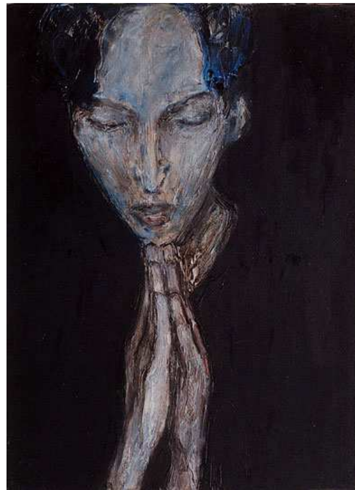
Серена Ноно (Венеция, Италия). Молящаяся. Холст. Масло. 40x30.